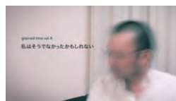
grained time #4 「私はそうでなかったかもしれない」 ビデオ／カラー／10分／Apr. 2017