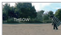
「THROW」 ビデオ／カラー／5分／Mar. 2010