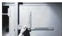
「FADE into WHITE #4」 ビデオ／B&W／20分／Apr. 2003 イメージフォーラムフェスティバル2001制作助成作品 キリンアートアワード2003 奨励賞 スロバキアアートフィルムフェスティバル トレンチン自治区賞