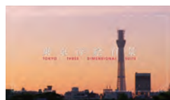
「東京浮絵百景」 3Dビデオ／カラー／14分／Oct. 2010 *佐藤理によるスペシャルリミックスバージョン 「FAX FACTORY」(2018 / 4:43) を上映