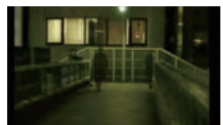
「z reactor」 ビデオ／カラー／11分／Apr. 2004 平成16年度 文化庁メディア芸術祭 アート部門 優秀賞 25fps (クローチア) The first prize