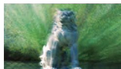
grained time #3 「対象との距離」 ビデオ／カラー／6分／Apr. 2013