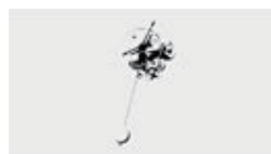
「FADE into WHITE #1」 ビデオ／B&W／5分／Apr. 1996 MTV STATION ID CONTEST '96 インパクト賞(短縮版) Apple Dream CM Contest グランプリ(『Slight Flight』/30秒/1997)