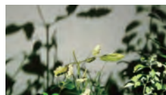
「in the forest of shadows」 ビデオ／カラー／11分／Apr. 2008