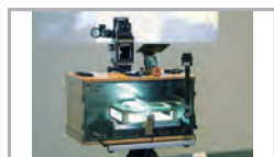
「これは映画ではないらしい」 インスタレーション／Apr. 2014 第18回 文化庁メディア芸術祭 アート部門 優秀賞受賞