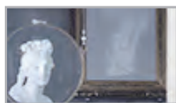
「画家の不在」 インスタレーション／Jan. 2018～