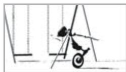
「FADE into WHITE #2」 ビデオ／B&W／11分／Apr. 2000 イメージフォーラムフェスティバル2001 大賞 メディアハンティング2000 審査員特別賞