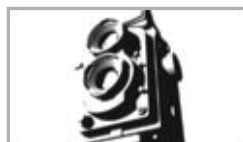
「FADE into WHITE #3」 ビデオ／パートカラー／14分／Sep. 2001 国際アニメーション映画祭アヌシー2003 入選 平成13年度文化庁メディア芸術祭 デジタルアート「ノンインタラクティブ」優秀賞 デジタルコンテンツグランプリ2001 新しい才能の部 優秀賞 プロジェクトチーム DoGA CGアニメコンテスト入選