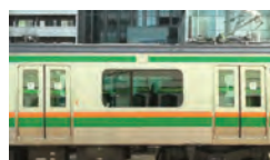
「相対位置」 ビデオ／カラー／11分／Apr. 2012