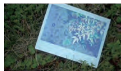
「見ること、聞くこと」 ビデオ／カラー／12分／Apr. 2015