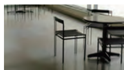
grained time #1 「不確定カメラ」 ビデオ／カラー／7分／Apr. 2009 平成21年度 文化庁メディア芸術祭 アート部門 審査委員会推薦作品(『grained time.』の一本として)